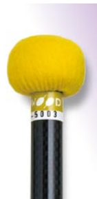
PRO-5003 ¥10,500 φ 25 × 395 黄フェルト