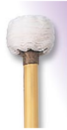
PRO-1003 ¥13,650 φ 34 × 380 コットンフランネル芯 本竹柄