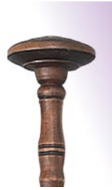
PRO-1001 ¥7,350 φ 35 × 292 ウッド芯・ウッド柄