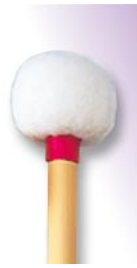
PRO-1004 ¥12,600 H φ 24 × 365 R無しコルク芯・本竹柄 ドイツフェルト