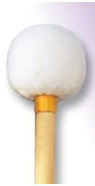
PRO-1007 ¥12,600 MS φ 20 × 365 R無しコルク芯・本竹柄 ドイツフェルト