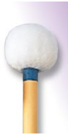
PRO-1005 ¥12,600 MH φ 22 × 365 R無しコルク芯・本竹柄 ドイツフェルト