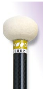
PRO-5002 ¥10,500 φ 32.5 × 395 硬質フェルト芯