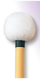
PRO-1006 ¥12,600 M φ 20 × 365 R無しコルク芯・本竹柄 ドイツフェルト