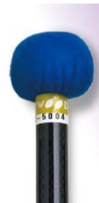
PRO-5004 ¥10,500 φ 25 × 395 青フェルト