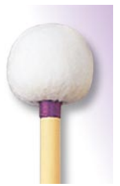
PRO-1008 ¥12,600 S φ 18 × 365 R無しコルク芯・本竹柄 ドイツフェルト