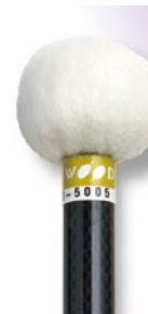
PRO-5005 ¥10,500 φ 25 × 395 ドイツフェルト