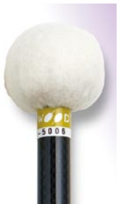
PRO-5006 ¥10,500 φ 25 × 395 ドイツフェルト

● スパーク pp ~ ff レンジまでの リズム・音程をソリス ティックに明確に表現